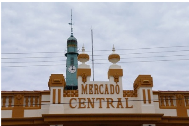
Figura 3 Inscrição da fachada do Mercado Público.

Na primeira etapa da investigação o enfoque da pesquisa é voltado a duas categorias específicas de tipografias perenes, a Tipografia Arquitetônica e a Tipografia de Registro. Abaixo seguem alguns registros fotográficos de tipografias arquitetônicas, encontradas em fachadas de prédios históricos (figuras 3, 4, 5 e 6) e inscrições de tipografia de registro encontradas em tampas das redes de esgoto e telefonia, nas ruas de Pelotas (figuras 7, 8 e 9).