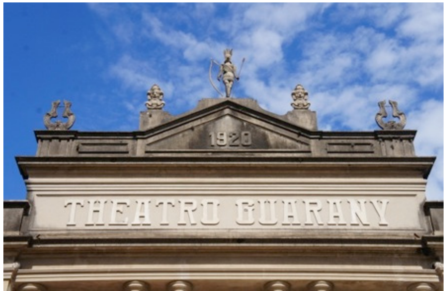
Figura 5 Monograma e numeração em fachada de prédio histórico.