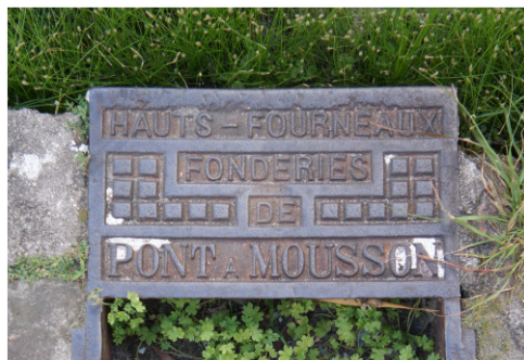
Figura 11 Ficha de catalogação – Tipografia de Registro (peça originária de usina de fundição francesa).