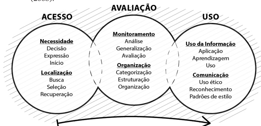
Figura 2 Componentes do processo de desenvolvimento de habilidades em informação.

Assim, conforme explica Lau (2008), o acesso diz respeito primeiramente à definição e ao reconhecimento da necessidade de informação, expressando-a e iniciando o processo de busca de maneira eficaz e eficiente. Além disso, este componente compreende a localização da informação, onde o usuário identifica e avalia as fontes, desenvolve estratégias de busca e acessa, seleciona e recupera a informação.