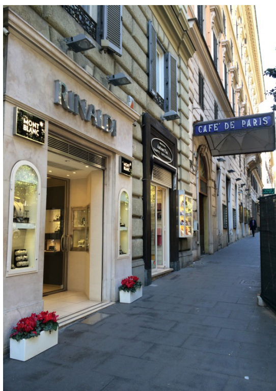
Figura 6 Anúncios indicativos com tipos vazados externos à edificação, toldos, vitrines externas e transformação nas fachadas. Via Vêneto, 03/2017.