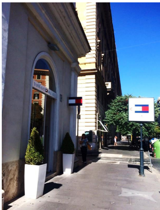
Figura 5 Anúncio indicativo no vão da porta, anúncio perpendicular e anúncio no espaço público gerido pela prefeitura. Via Cola di Rienzo, 07/2017.