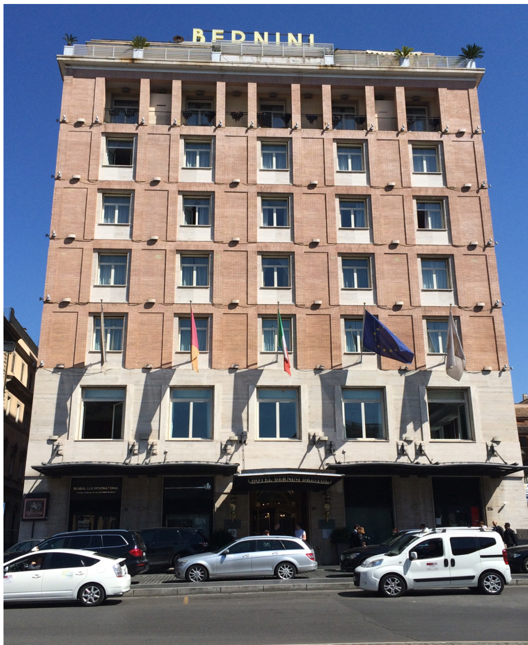
Figura 7 Anúncio em terraço em hotel da Piazza Barberini . 03/2017.

Embora mais permissiva quanto a variabilidade de tipologias permitidas para uso no âmbito da edificação, sua implantação requer, na maioria dos casos, um projeto aprovado pela prefeitura e no qual os anúncios nunca se sobrepõem hierarquicamente a qualquer elemento arquitetônico na composição das fachadas.