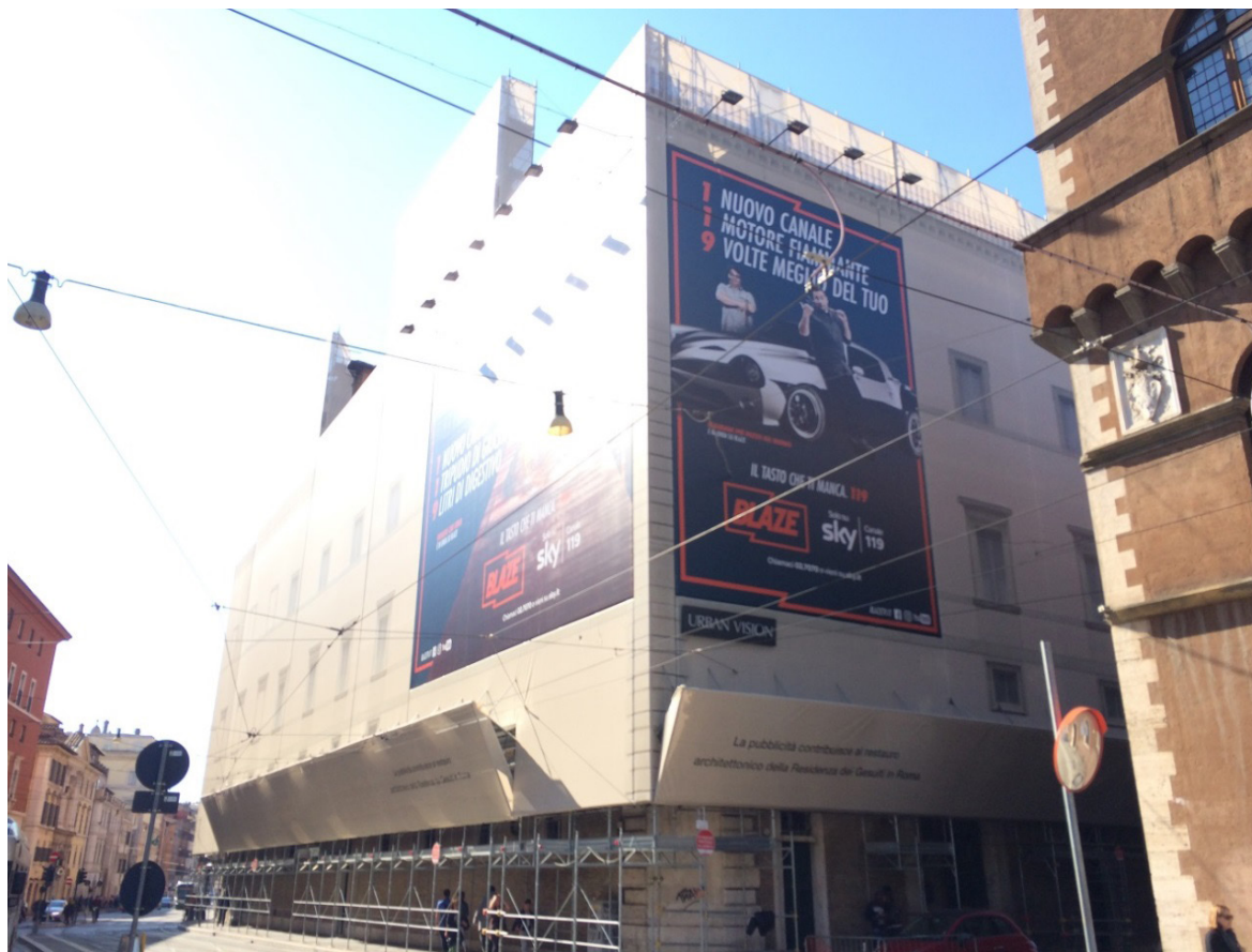
Figura 1 Residência dos Jesuítas em Roma. Lê-se nos andaimes: “A publicidade contribui ao restauro da residência dos jesuítas em Roma”. Vista Sudeste.