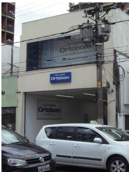
Figura 3 Imagem da disposição de anúncios permitida pela Lei Cidade Limpa (Lei 14.223/06), recuo de 1m a partir da testada para anúncios adicionais. Rua Teodoro Sampaio, 2012.