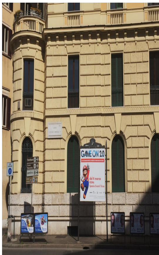
Figura 9 Variações tipológicas 1.A, 1.B e 3.A representadas na tabela. Corso Vittorio Emanuele II, 03/2017.