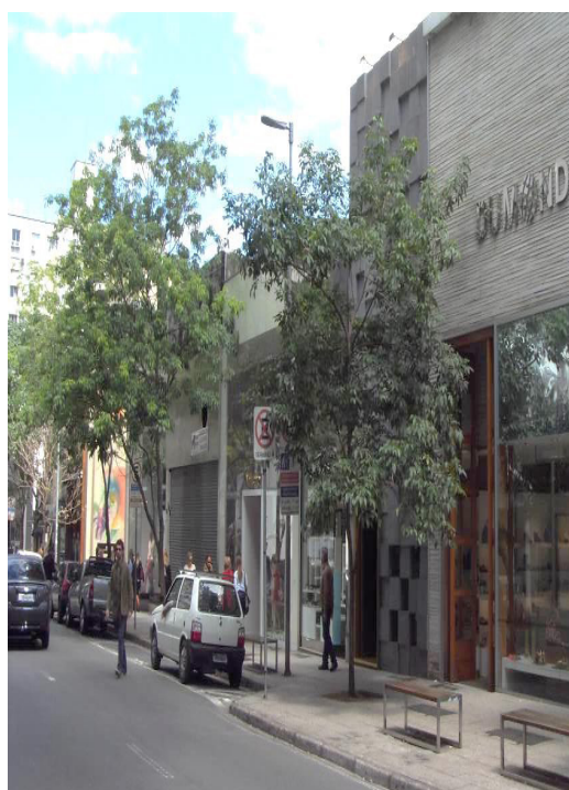
Figura 4 Imagem do anúncio indicativo na fachada enquadrado na Lei Cidade Limpa. Rua Oscar Freire, 2012.