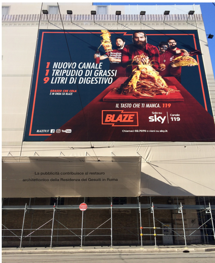
Figura 2 Residência dos Jesuítas em Roma. Lê-se nos andaimes: “A publicidade contribui ao restauro da residência dos jesuítas em Roma”. Vista parcial da fachada Sul.

Além das normativas mencionadas, quem pretende dispor anúncios visíveis do espaço público deve estar atento ao “Codice della Strada” (Código Viário - Decreto Legislativo de 30 de Abril de 1992 n.285), outra lei federal que menciona a publicidade em diversos artigos, no sentido de zelar pela segurança no trânsito.