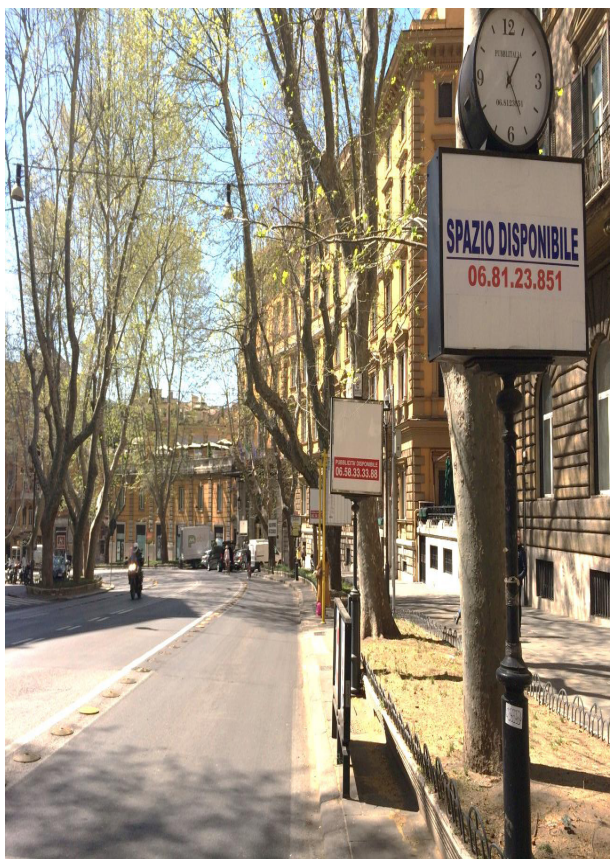
Figura 8 Conjunto de mobiliário urbano com espaços disponíveis (livres) para anúncios: Relógio em primeiro plano, seguido pelas placas do tipo 1.C/3.C da tabela (sem relógio), totens de transporte coletivo (estrutura amarela) seguido por mais 3 outras placas de publicidade, duas das quais com espaços disponíveis para anúncio. Via Veneto, 03/2017.

As figuras abaixo ilustram algumas das tipologias apresentadas na tabela acima.